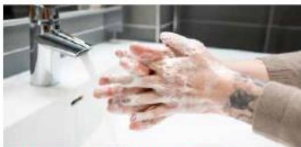
4. Hiero sormia lomittain vastatusten