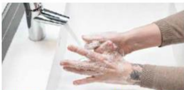
3. Hiero kämmenselät, peukalot ja sormien välit