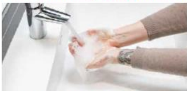
5. Huuhdo kädet runsaalla vedellä