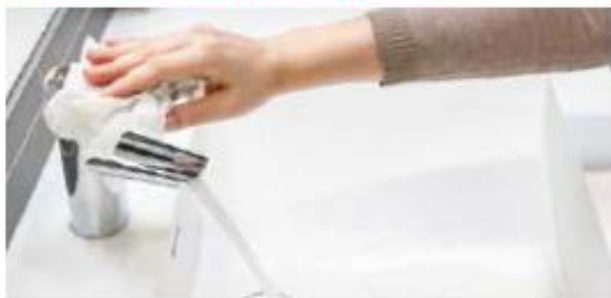
7. Sulje hana käsipyyhepaperilla