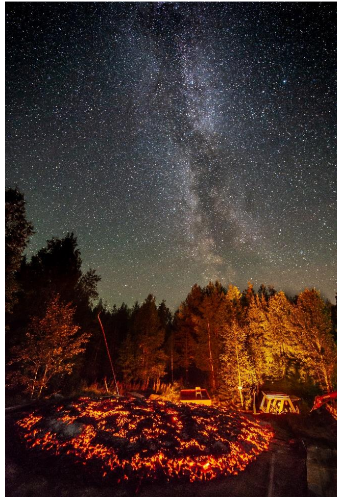
Joululehden kuva: Vimpelin Joulu 2019

Lisätietoja Vimpeli-Seuran kotisivuilta www.vimpeli-seura.fi