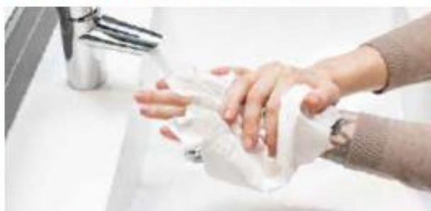
6. Kuivaa kätesi huolellisesti käsipyyhepaperilla