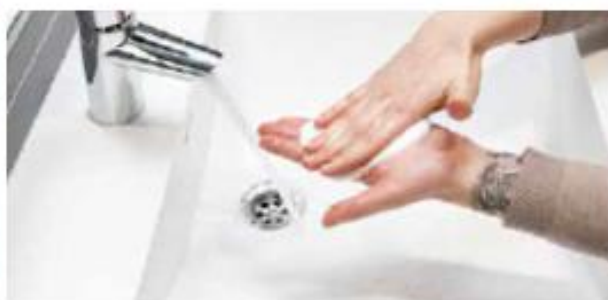
2. Ota saippuaa ja hiero kämmeniä vastakkain