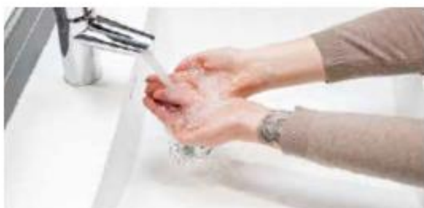
1. Kastele kädet runsaalla vedellä